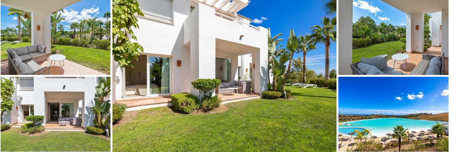
Charmante Erdgeschosswohnung in Alcazaba Hills

Diese gemütliche Erdgeschosswohnung befindet sich in der ruhigen und exklusiven Wohnanlage Alcazaba Hills, direkt neben der berühmten Alcazaba Lagoon. Dank der Südausrichtung genießen Sie eine friedliche Atmosphäre mit wunderschönem Blick auf die üppigen Gärten und die umliegenden Berge.