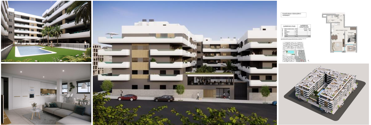
NEU GEBaute WOHNANLAGE IN SANTA POLA

Neubau einer modernen, bewachten Wohnanlage, bestehend aus Wohnungen und Penthäusern mit 1, 2 und 3 Schlafzimmern und 2 kompletten Bädern. Der Komplex besteht aus 4 Treppenhäusern mit großzügigen, landschaftlich gestalteten Gemeinschaftsbereichen, einschließlich Schwimmbad, Entspannungsbereich und Fitnessraum. Alle Wohnungen wurden sorgfältig entworfen, um Ihnen ein außergewöhnliches Wohnerlebnis zu bieten, mit hochwertigen Ausstattungen und einem modernen Stil. Genießen Sie die großzügigen Terrassen, auf denen Sie sich entspannen, im Freien essen und die spektakulärsten Sonnenuntergänge beobachten können.