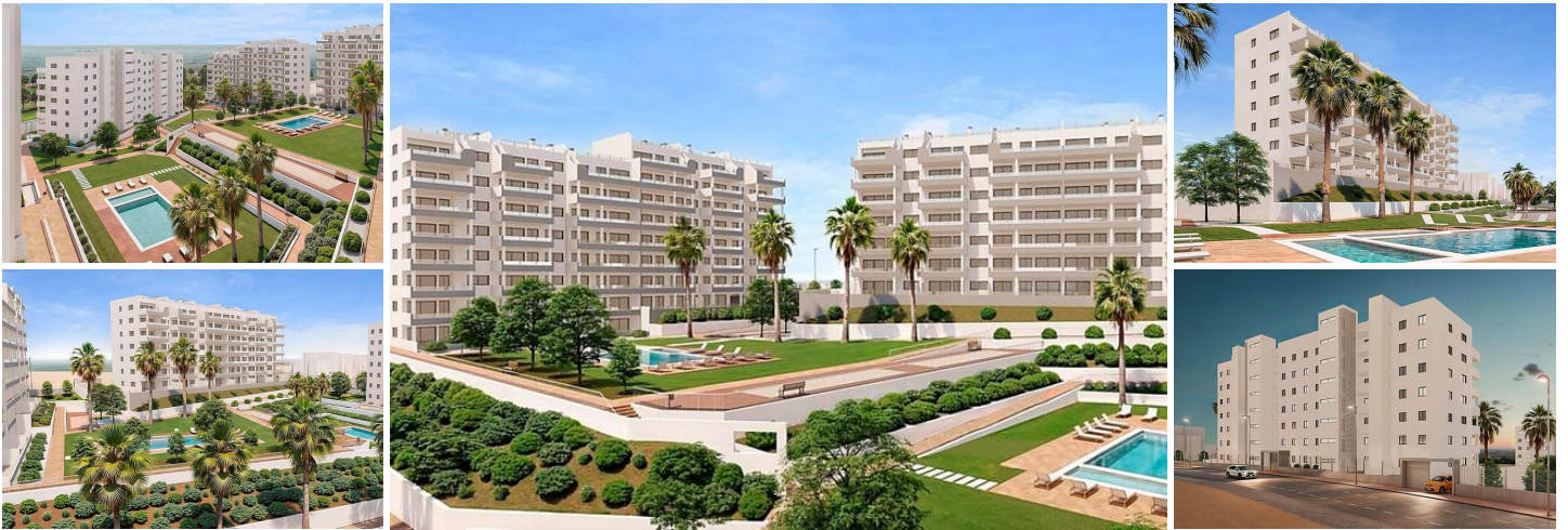
Neue Wohnsiedlung in San Miguel de Salinas

Exklusive Wohnungen in einer einzigartigen natürlichen Umgebung