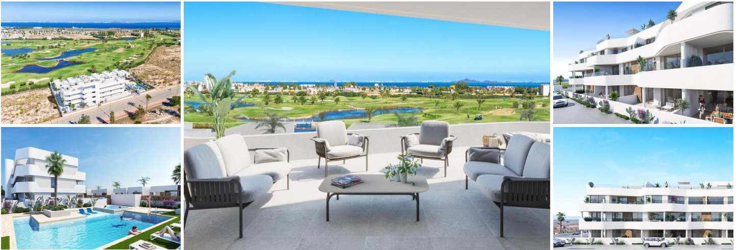
Neubau-Wohnanlage in Los Alcazares

Los Alcázares ist ein idyllischer Ort für diejenigen, die in eine neue Wohnimmobilie an der Costa Cálida investieren möchten. Nur 25 Minuten vom Flughafen Murcia und ca. 55 Minuten vom Flughafen Alicante entfernt, ist diese Gegend über die Autobahn bequem mit den großen Städten wie Cartagena, Murcia und Alicante sowie mit anderen schönen Stränden an der Costa Cálida und der Costa Blanca verbunden.