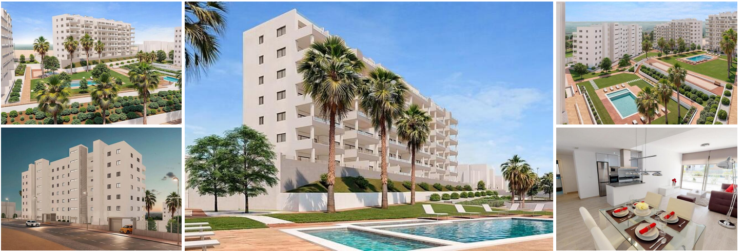
Neue Wohnsiedlung in San Miguel de Salinas

Exklusive Wohnungen in einer einzigartigen natürlichen Umgebung