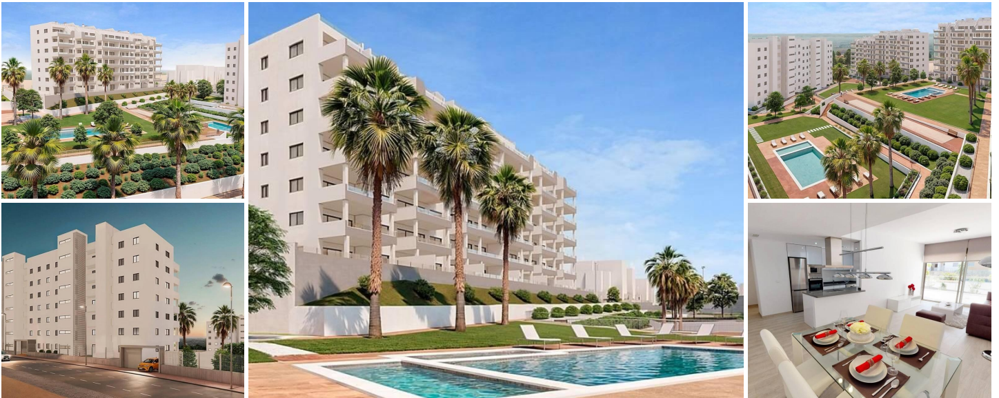
Neue Wohnsiedlung in San Miguel de Salinas

Exklusive Wohnungen in einer einzigartigen natürlichen Umgebung