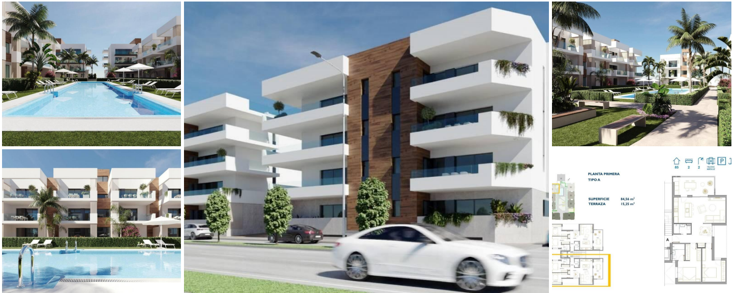
NEUBAU WOHNANLAGE IN SAN PEDRO DEL PINATAR

Neue Wohnanlage mit modernen Apartments und Penthäusern in San Pedro Del Pinatar.