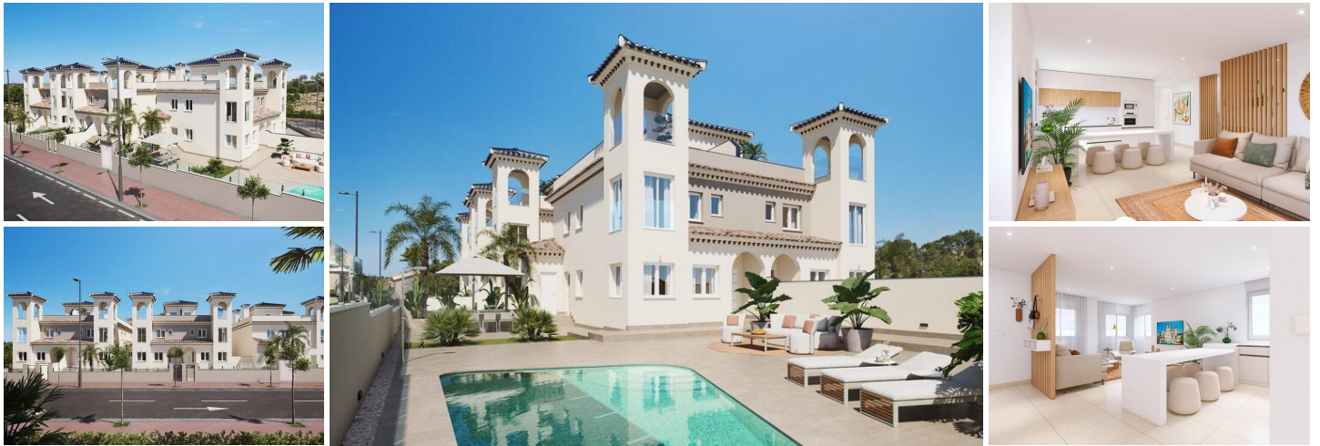
Exklusive Doppelhaushälften und Villen in Bigastro, Alicante

Häuser im mediterranen Stil im Herzen der Vega Baja