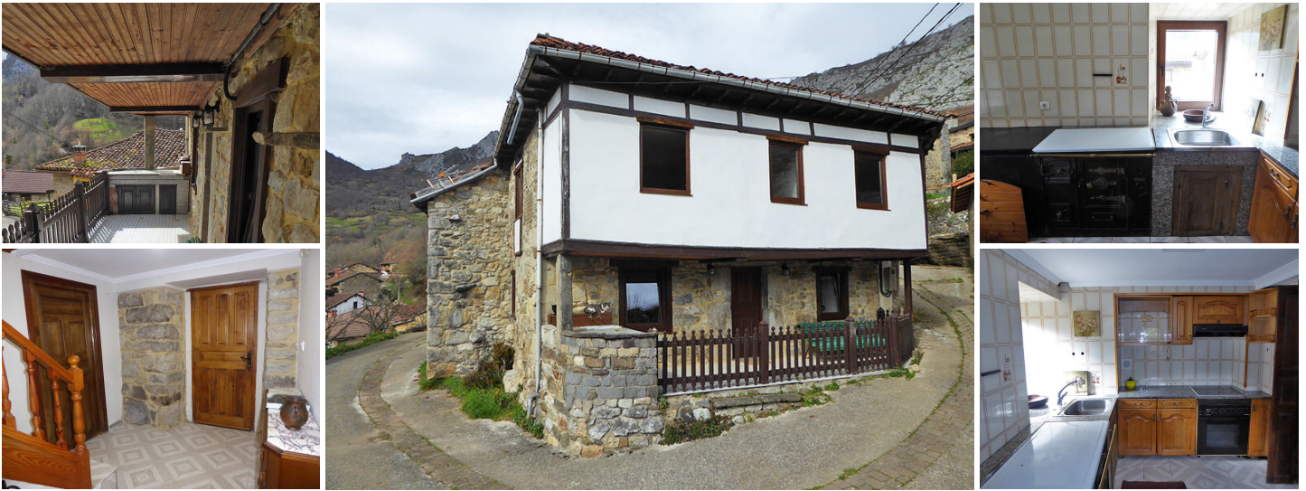
Dorfhaus in Calaeo

Ein schönes, bewohnbares altes Steinhaus zum Verkauf im schönen Dorf Calaeo, im Herzen des Naturparks Redes. Die Lage am oberen Rand dieses mittelalterlichen Dorfes garantiert einige fantastische Ausblicke und da dies das Ende des Tals ist, ist Ruhe garantiert, da keine vorbeifahrenden Autos die Ruhe stören. Die Straßen im Dorf sind eng, aber Sie können trotzdem direkt zum Grundstück fahren, das über eine Garage und einen praktischen Parkplatz an der Seite verfügt. Das Haus ist das Ende einer Reihe von Terrassen und ist sowohl nach Osten als auch nach Süden in Richtung der Berge ausgerichtet. Die schöne überdachte Terrasse vor dem Haus ist groß genug, um einen Sitzbereich unterzubringen, um diese atemberaubende Aussicht zu genießen, und es gibt auch eine kleine Küchenarbeitsfläche mit einigen Lagerschränken und einer Spüle, ideal für Grillabende im Freien.