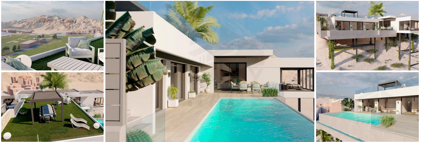
Moderne Luxusvillen mit Golfplatzblick in Ciudad Quesada

Exklusive neue Entwicklung mit Blick auf den La Marquesa Golfplatz