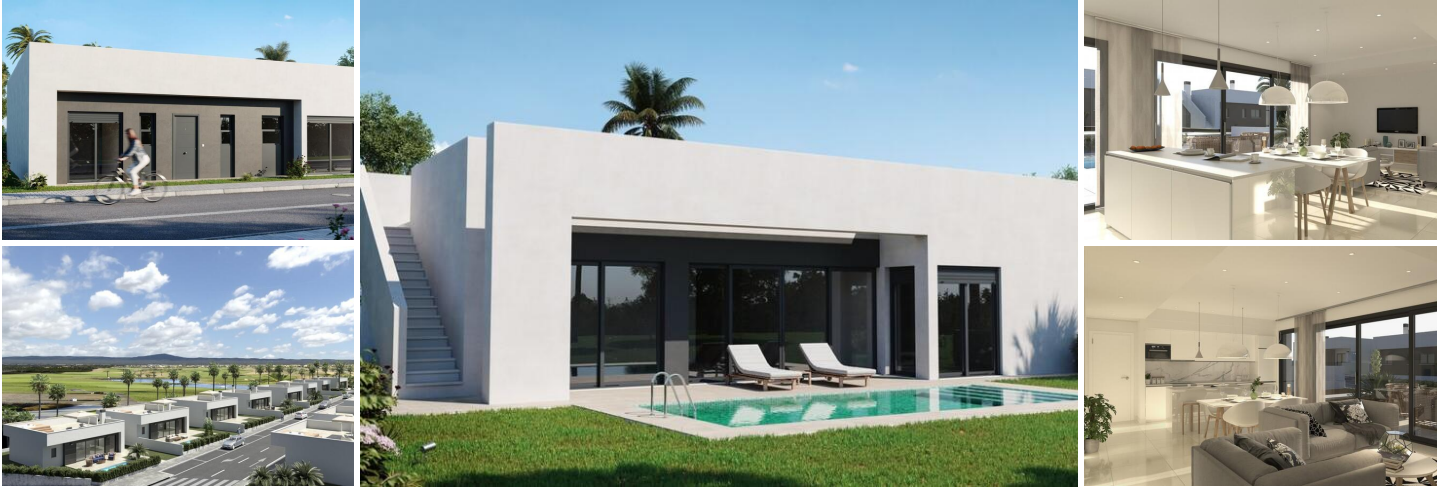
MEDITERRANE VILLA AUF DEM GOLFPLATZ