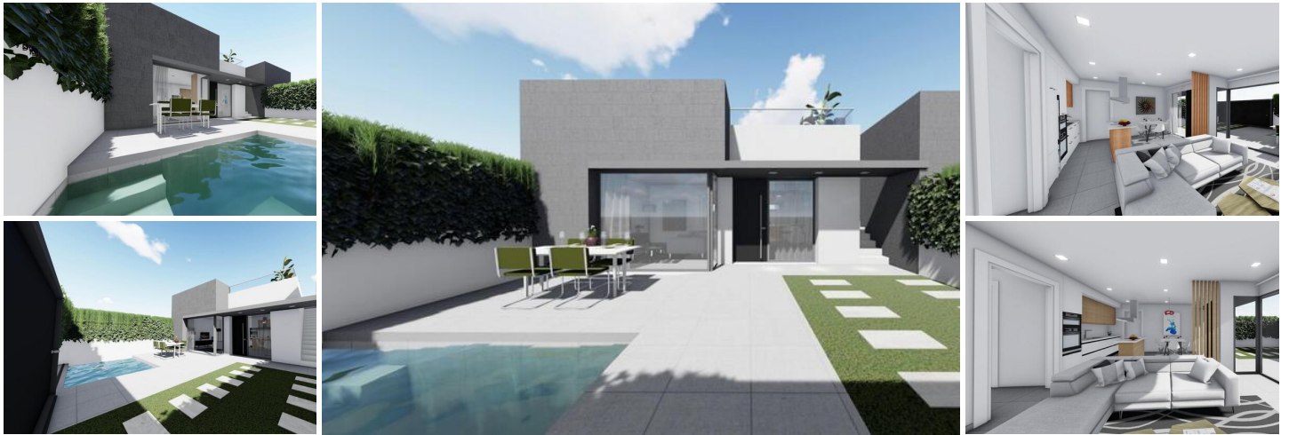
NEUBAU VILLEN SAN JUAN DE LOS TERREROS, ALMERIA

26 Neubauten Moderne Erdgeschossvillen mit Solarium und privatem Pool, 2 und 3 Schlafzimmer, 500 Meter von den Stränden entfernt.