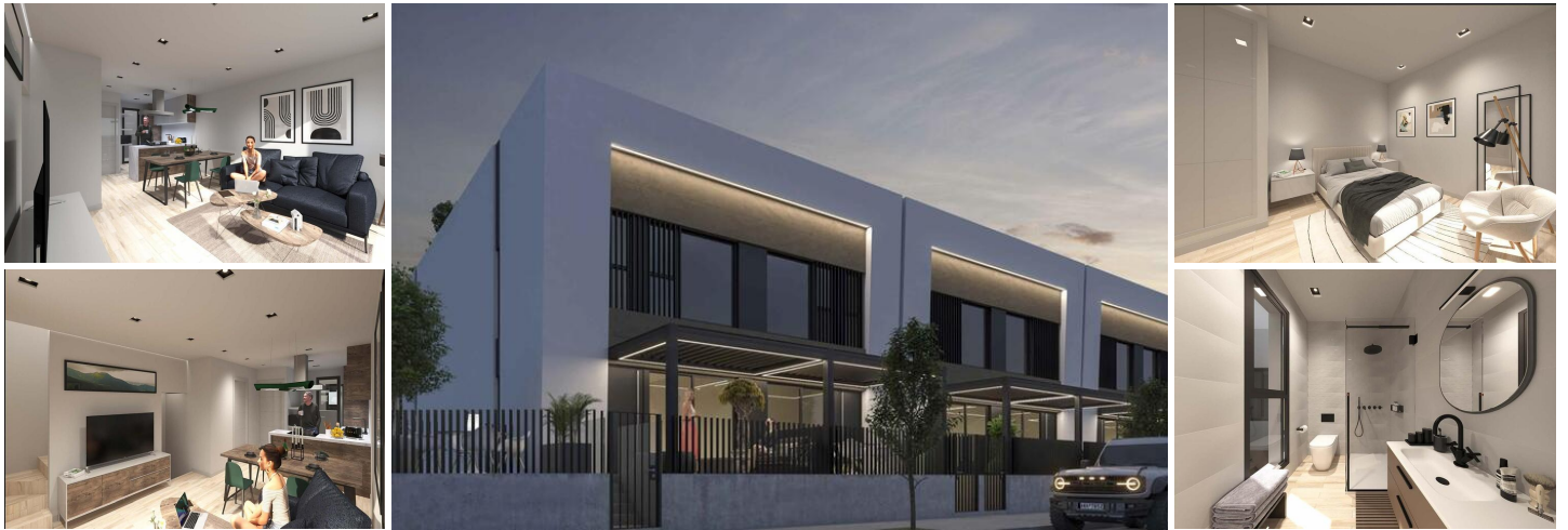
Moderne Stadthäuser in Dolores mit Gemeinschaftspool