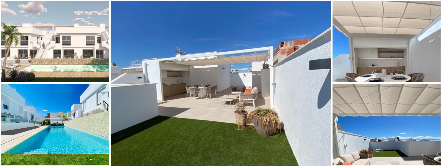
Neubau einer Bungalow-Wohnanlage in Pilar de la Horadada