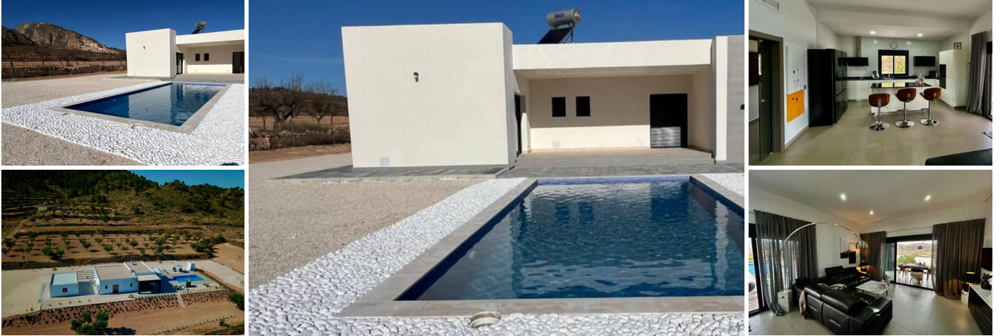
NEUGEBaute VILLA IN HONDON DE LAS NIEVES

Neubau-Villa auf einem großen Grundstück in der Gemeinde Hondón de las Nieves.