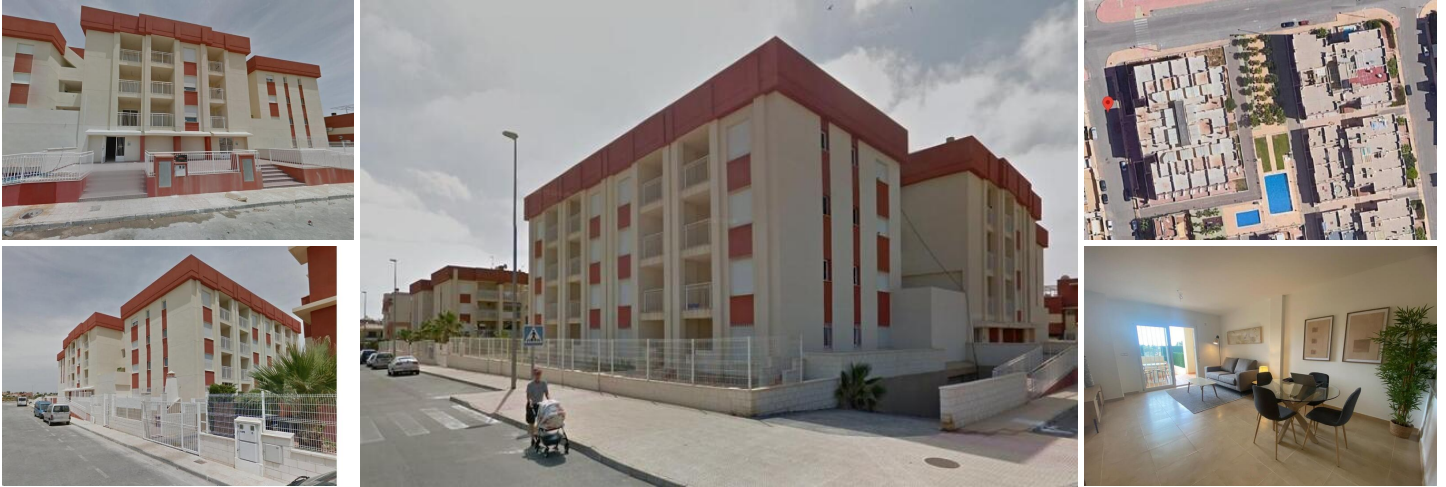
Sanierte Wohnanlage in Lomas de Cabo Roig - Renovierte Wohnungen