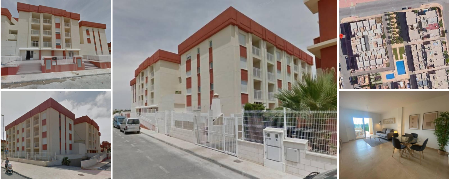
Sanierte Wohnanlage in Lomas de Cabo Roig - Renovierte Wohnungen