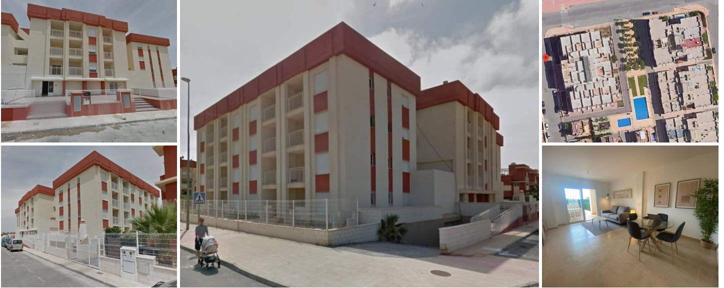
Sanierte Wohnanlage in Lomas de Cabo Roig - Renovierte Wohnungen