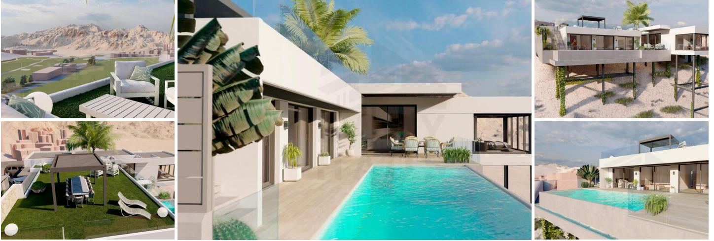
Moderne Luxusvillen mit Golfplatzblick in Ciudad Quesada

Exklusive neue Entwicklung mit Blick auf den La Marquesa Golfplatz