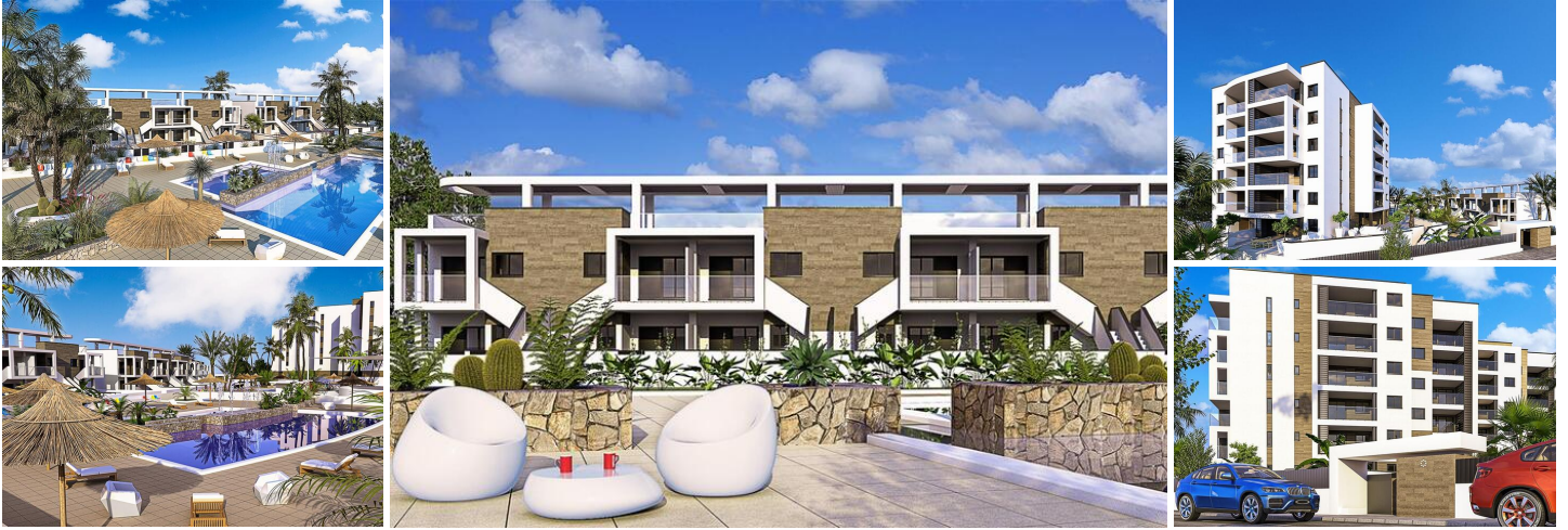
Neubau von Wohnungen und Bungalows in Mil Palmeras