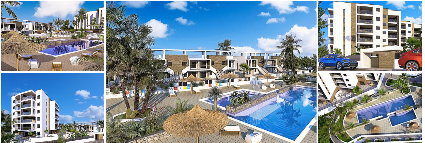
Neubau von Wohnungen und Bungalows in Mil Palmeras