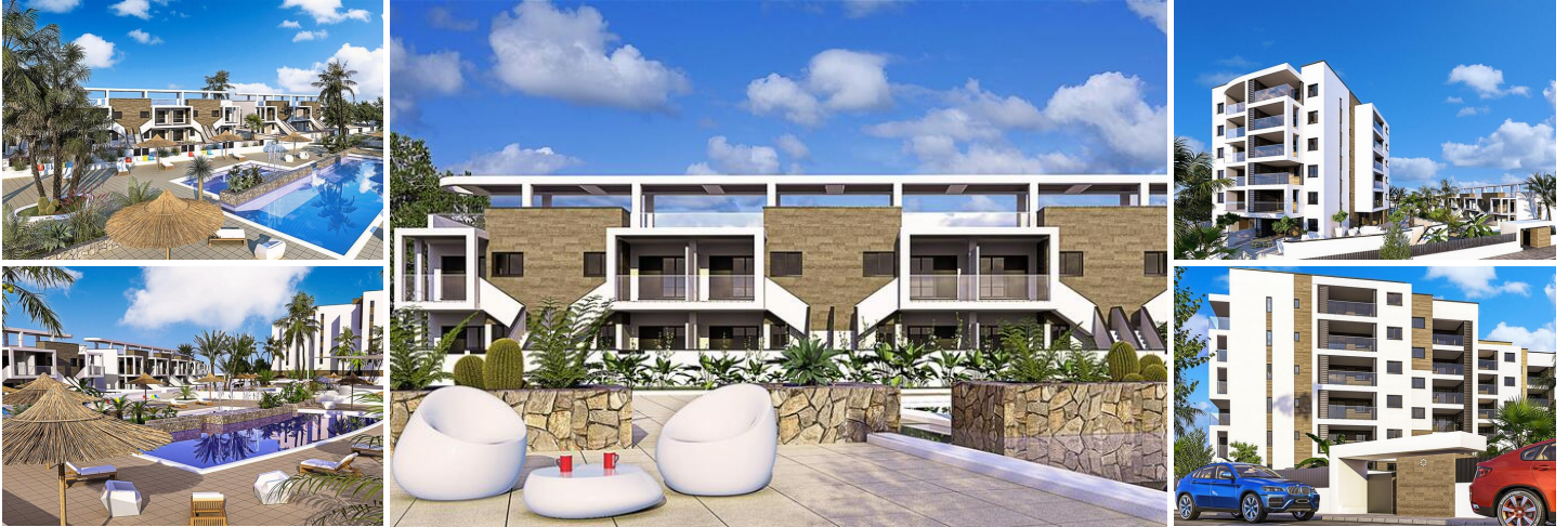
Neubau von Wohnungen und Bungalows in Mil Palmeras