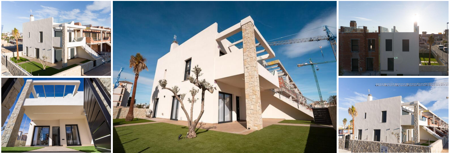
Neubau von Bungalows und Villen in Pilar de la Horadada