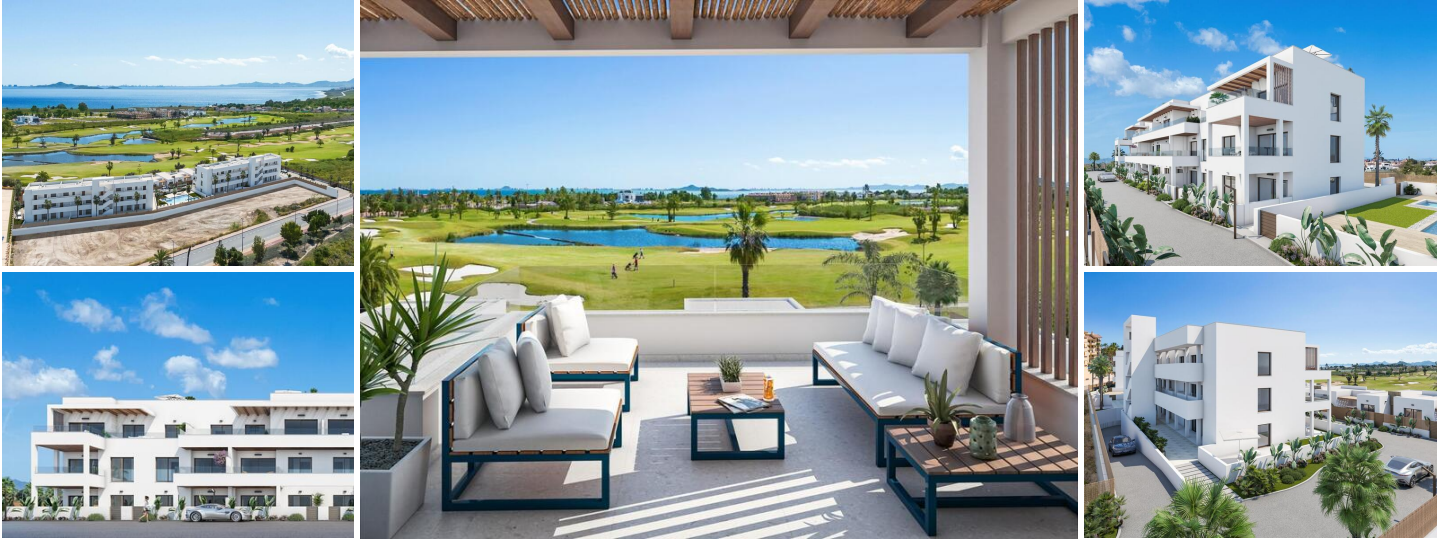
Neubau wohnanlage in los alcazares

Die Neubausiedlung besteht aus 32 Apartments und Penthäusern mit 2 und 3 Schlafzimmern und 9 exklusiven Villen, die modernes Design, Qualität und Funktionalität vereinen.