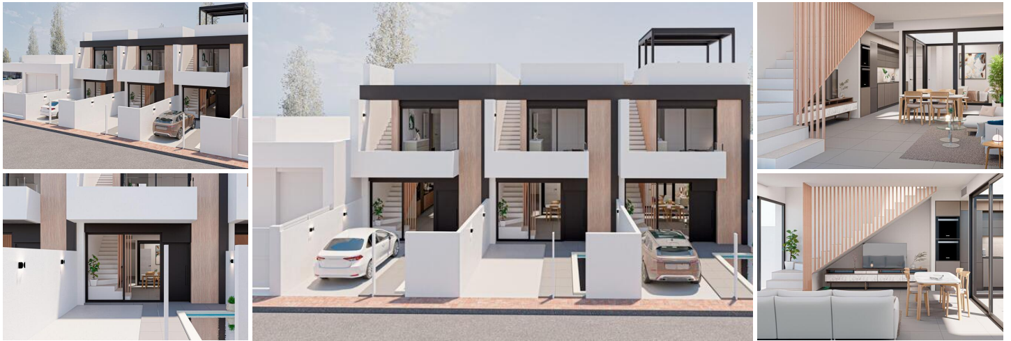
Neubau-Stadthäuser in San Pedro del Pinatar

Luxuriöse Stadthäuser in der Nähe des Mittelmeers und des Mar Menor