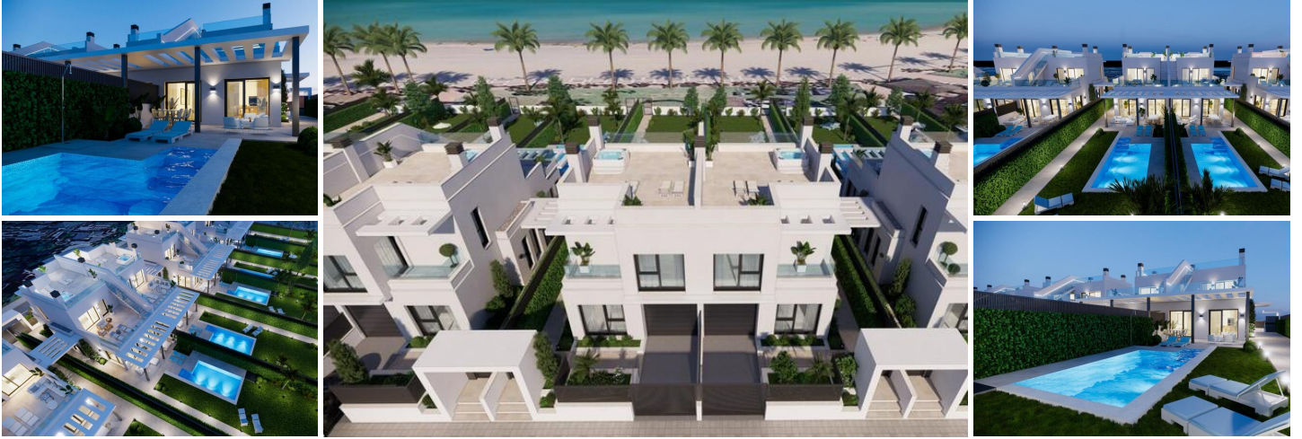
Luxuriöse Neubauvillen am Wasser in Los Alcázares

Entdecken Sie das ultimative mediterrane Leben mit diesem exklusiven Wohnprojekt, das neun moderne Villen direkt am Wasser in der wunderschönen Küstenstadt Los Alcázares in Murcia umfasst. Die Villen befinden sich in der begehrten Gegend Nueva Ribera und sind auf Luxus, Privatsphäre und Bequemlichkeit ausgelegt. Golfplätze, Einkaufszentren und Verkehrsknotenpunkte sind von hier aus bequem zu erreichen. Jede Villa bietet eine hochwertige Ausstattung, einen atemberaubenden Meerblick und einen privaten Pool und ist damit die ideale Wahl für alle, die einen modernen Rückzugsort an der Küste suchen.