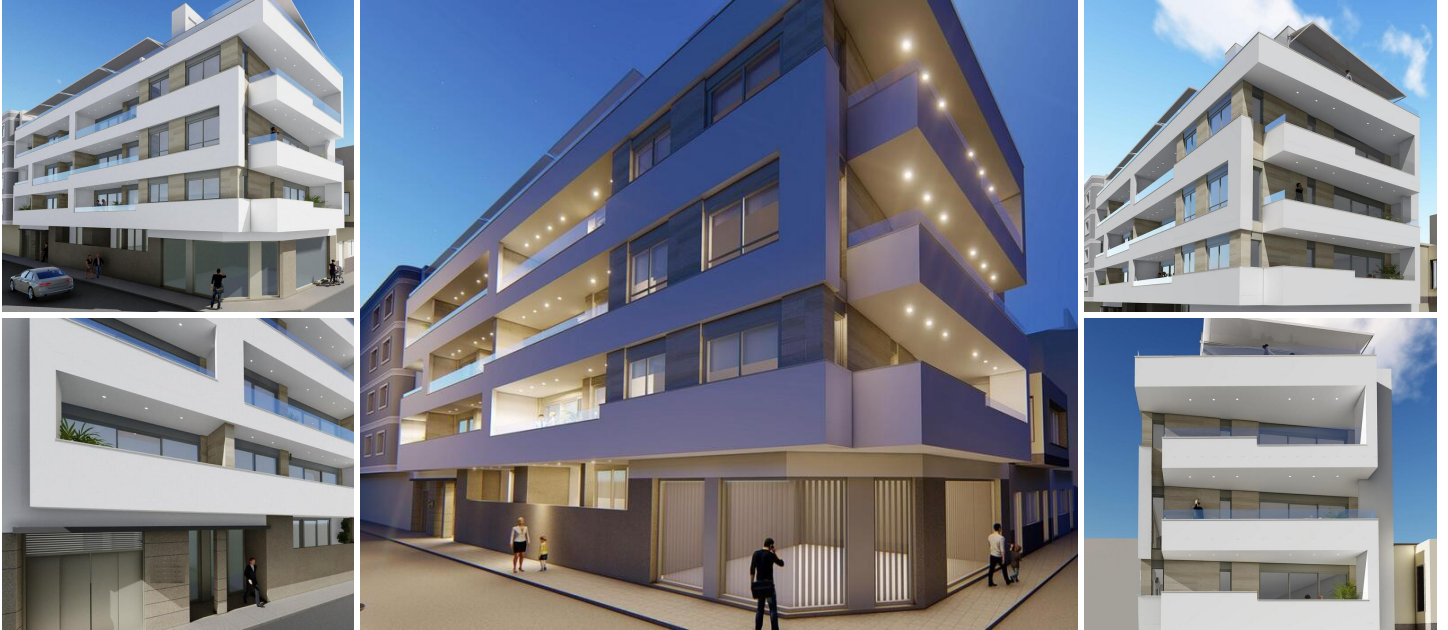
Neubau wohnung in torrevieja

Neubau Wohnanlage nur 5 Minuten zu Fuß vom Strand Los Locos, im Zentrum von Torrevieja.