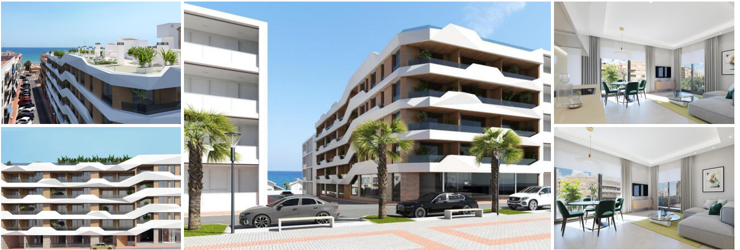
Neubau wohnungen in guardamar del segura

Neubau von Wohnungen und Penthäusern in Guardamar del Segura.