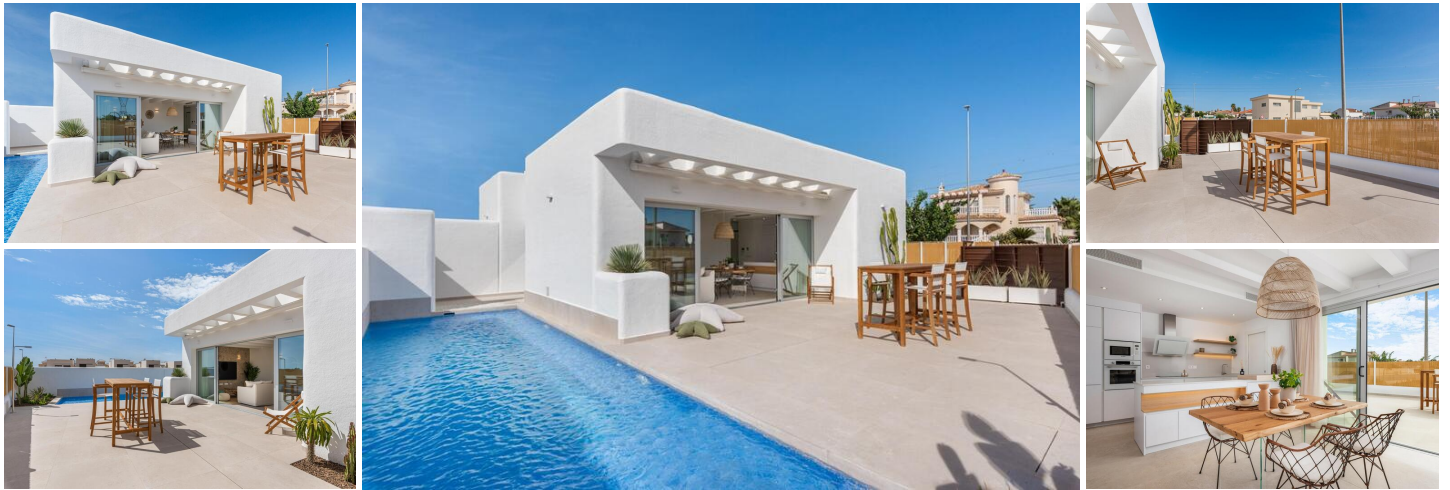
Neubau-villen in dolores

Neubauvillen im ibizenkischen Stil auf unabhängigen Grundstücken in Dolores.