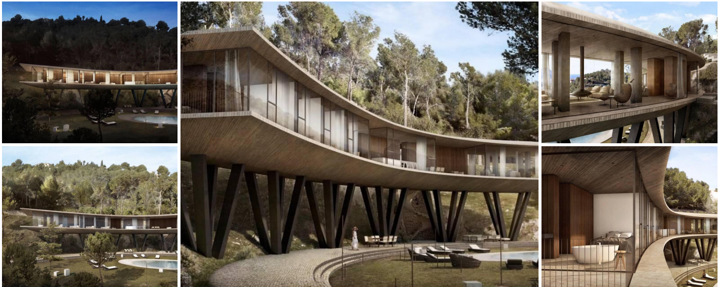
Luxus-Villa der Avantgarde mit Meerblick in Benissa Costa

Exklusive Villa in Racó de Galeno, Benissa