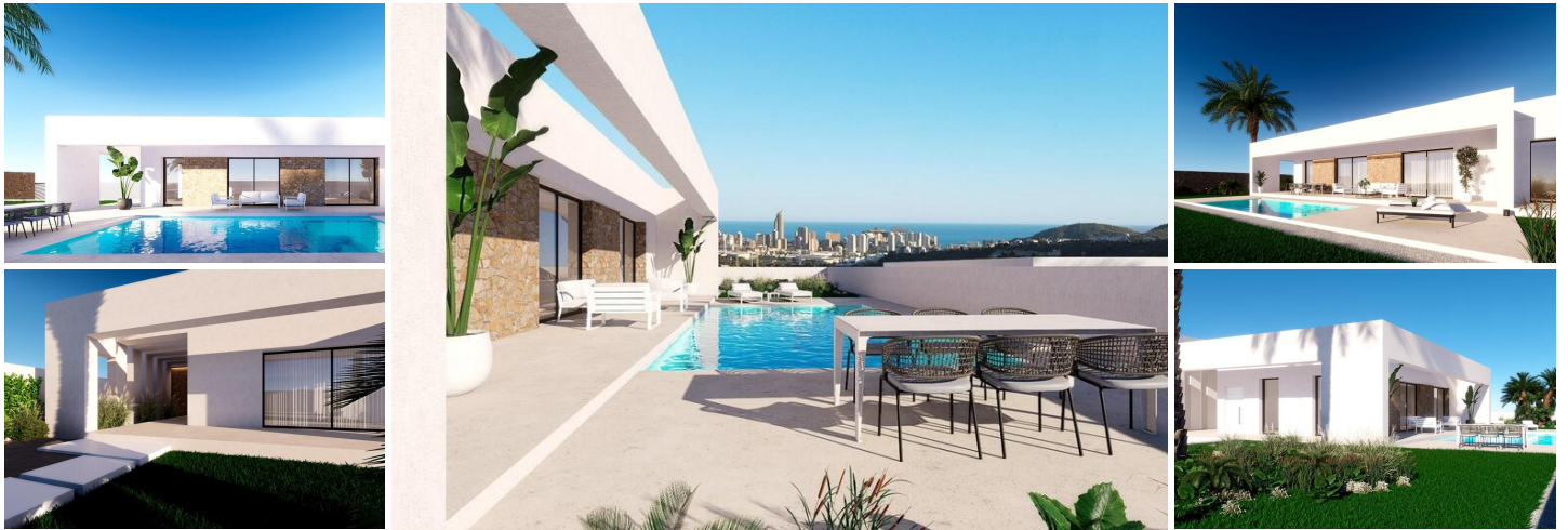
Neubauvillen mit Meerblick in Finestrat-Benidorm

Exklusive Wohnanlage mit Blick auf das Meer und die Stadt Benidorm.