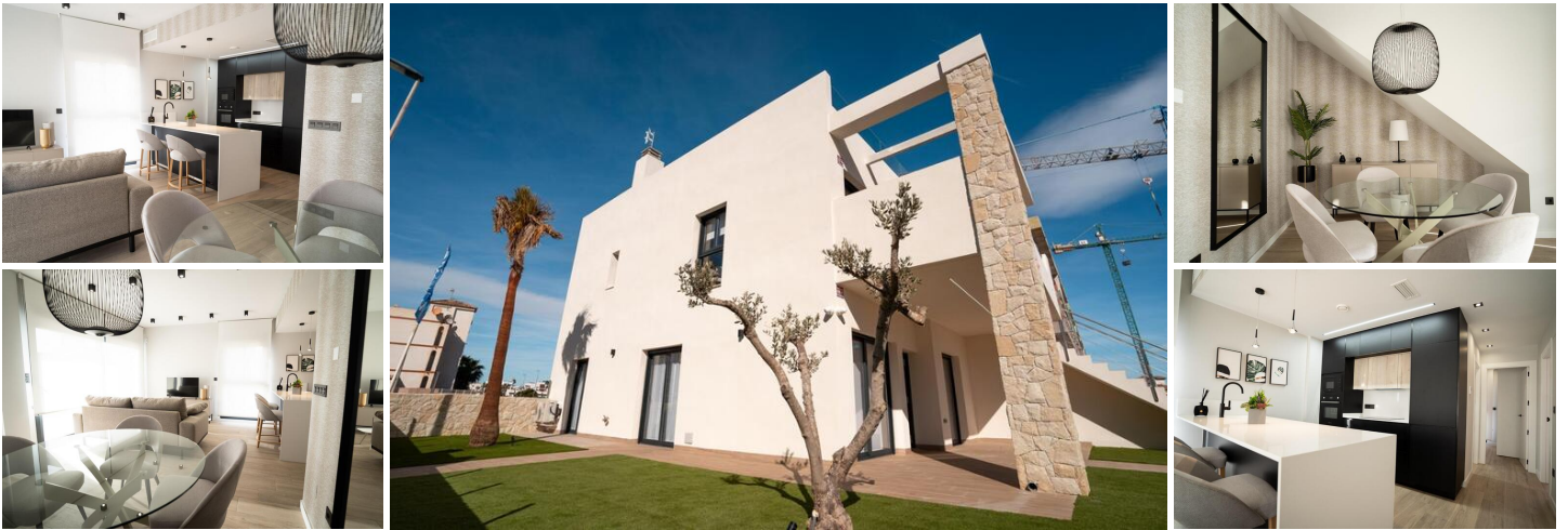
Bungalows aus neuer Konstruktion in Pilar de la Horadada