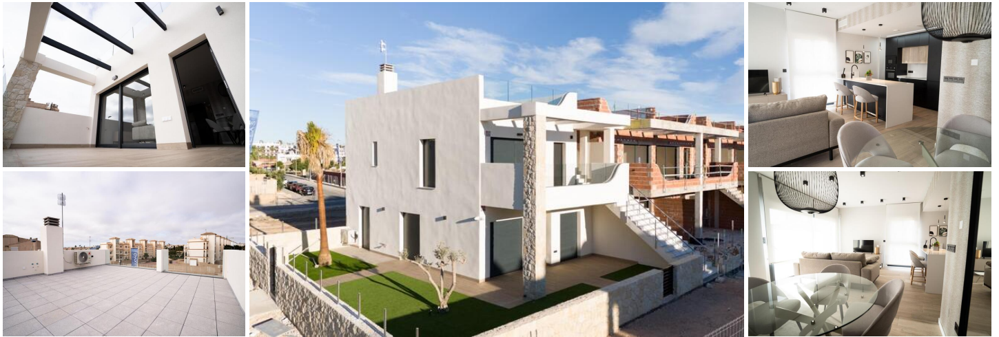
Neubau von Bungalows und Villen in Pilar de la Horadada