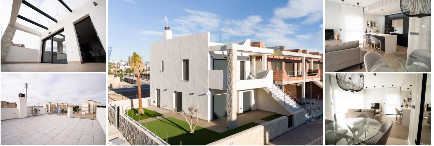
Neubau von Bungalows und Villen in Pilar de la Horadada