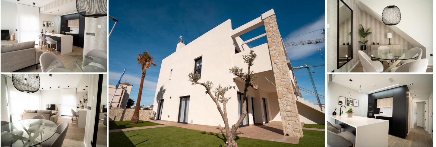
Bungalows aus neuer Konstruktion in Pilar de la Horadada