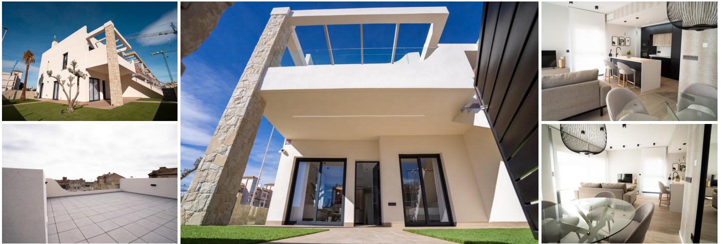
Bungalows aus neuer Konstruktion in Pilar de la Horadada