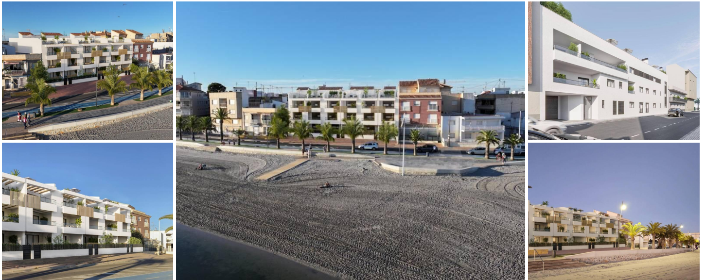
NEUBAU EINER WOHNANLAGE IN ERSTER LINIE IN SAN PEDRO DEL PINATAR

Lo Pagan liegt am bezaubernden Mar Menor und ist eine Stadt in Murcia, die eine nahtlose Mischung aus natürlicher Schönheit und kulturellem Reichtum bietet. Sie ist der perfekte Zufluchtsort für alle, die eine ruhige Oase suchen. Lo Pagan ist vom Flughafen Alicante aus in nur 57 Minuten zu erreichen und lädt dazu ein, sich in diesem idyllischen spanischen Küstenort zu entspannen, ihn zu erkunden und schöne Erinnerungen zu schaffen.