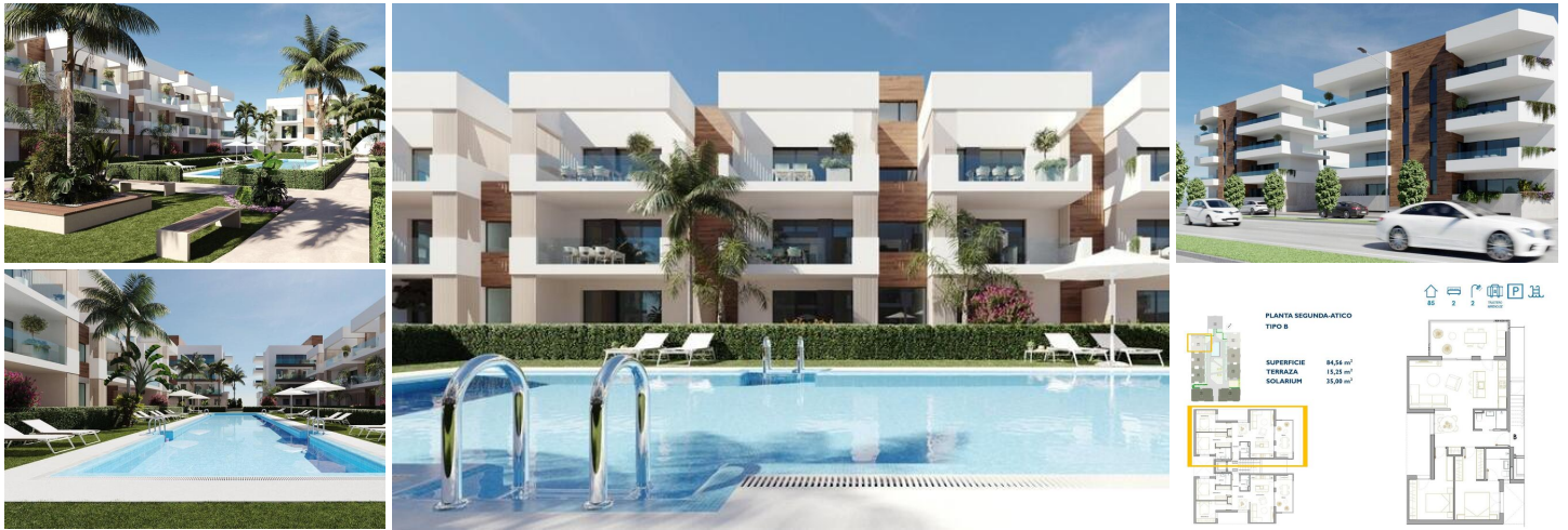
NEUBAU WOHNANLAGE IN SAN PEDRO DEL PINATAR

Neue Wohnanlage mit modernen Apartments und Penthäusern in San Pedro Del Pinatar.