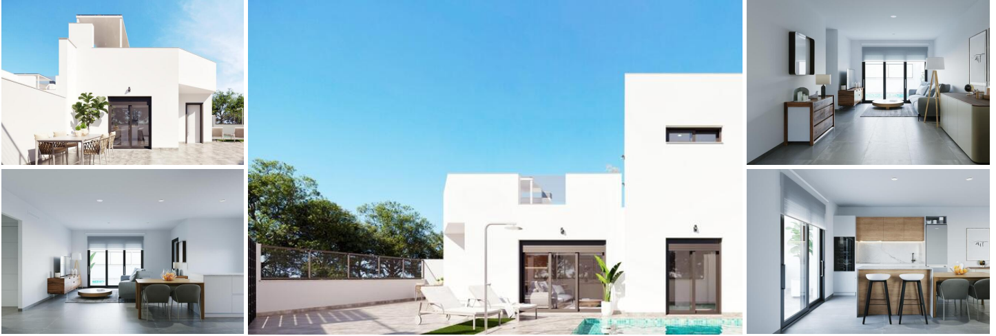
NEUBAU EINER WOHNANLAGE IN TORRE-PACHECO

Neubausiedlung mit 8 Reihenhäusern und Vierfamilienhäusern in Torre-Pacheco