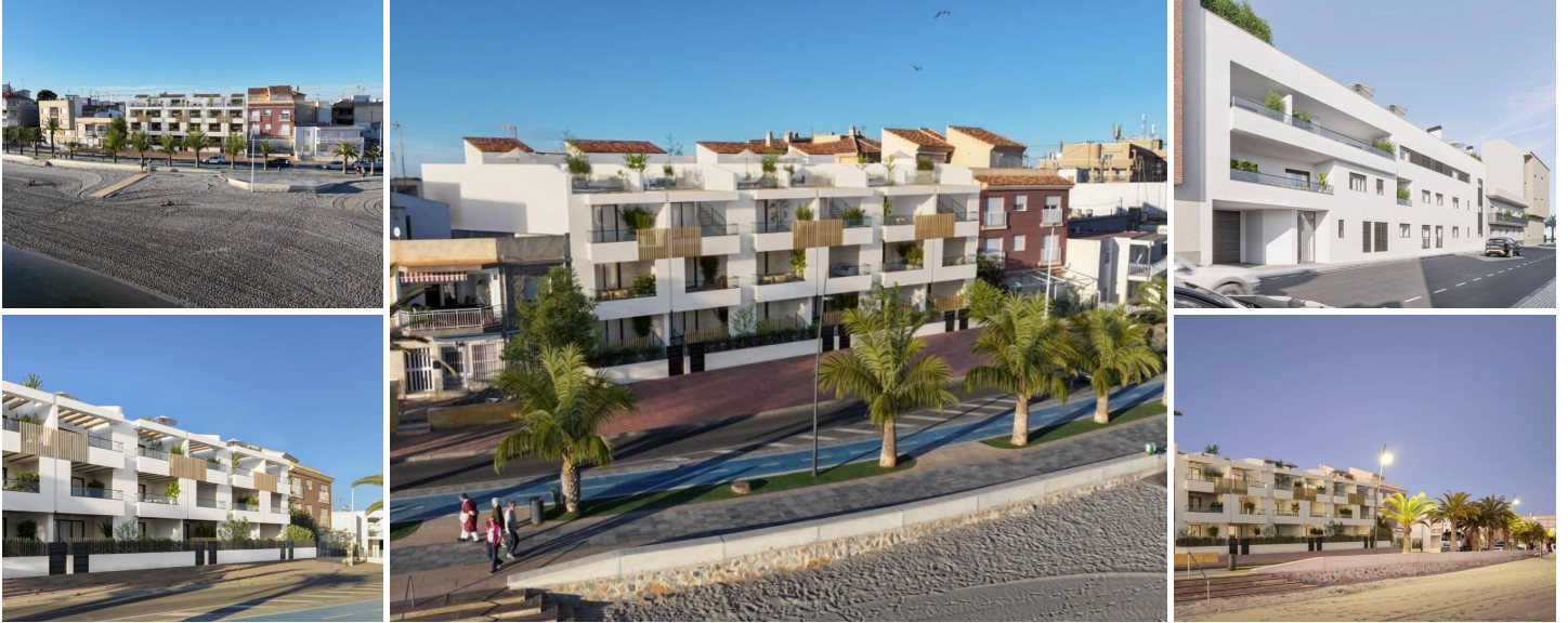
NEUBAU EINER WOHNANLAGE IN ERSTER LINIE IN SAN PEDRO DEL PINATAR

Lo Pagan liegt am bezaubernden Mar Menor und ist eine Stadt in Murcia, die eine nahtlose Mischung aus natürlicher Schönheit und kulturellem Reichtum bietet. Sie ist der perfekte Zufluchtsort für alle, die eine ruhige Oase suchen. Lo Pagan ist vom Flughafen Alicante aus in nur 57 Minuten zu erreichen und lädt dazu ein, sich in diesem idyllischen spanischen Küstenort zu entspannen, ihn zu erkunden und schöne Erinnerungen zu schaffen.