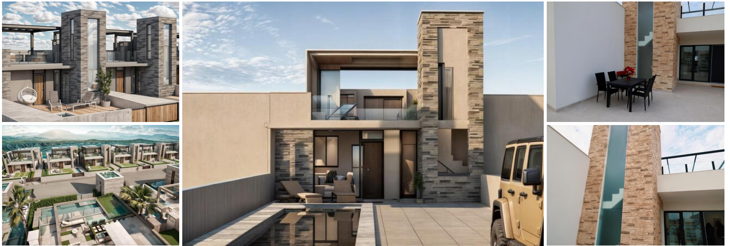
NEU GEBaute STADTHÄUSER IN FUENTE ALAMO, MURCIA

Neubau von Villen und Stadthäusern in Fuente Álamo, Murcia.