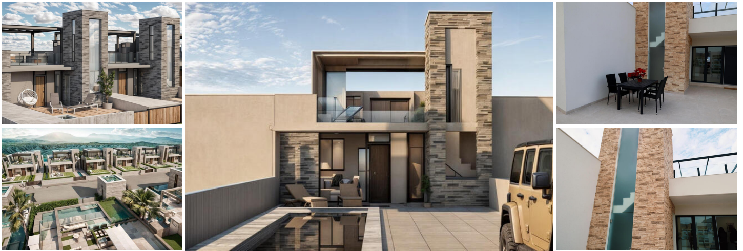
NEU GEBaute STADTHÄUSER IN FUENTE ALAMO, MURCIA

Neubau von Villen und Stadthäusern in Fuente Álamo, Murcia.