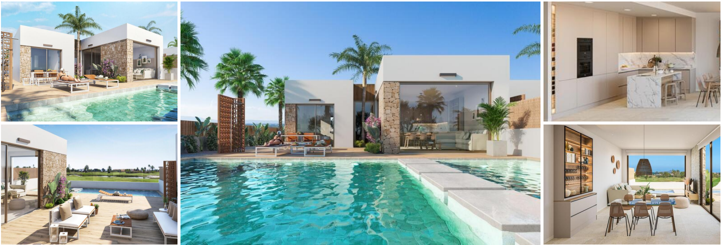
Neu gebaute Villen in Los Alcazares

Los Alcázares ist ein idyllischer Ort für diejenigen, die in eine neue Wohnimmobilie an der Costa Cálida investieren möchten. Nur 25 Minuten vom Flughafen Murcia und ca. 55 Minuten vom Flughafen Alicante entfernt, ist diese Gegend über die Autobahn bequem mit den großen Städten wie Cartagena, Murcia und Alicante sowie mit anderen schönen Stränden an der Costa Cálida und der Costa Blanca verbunden.