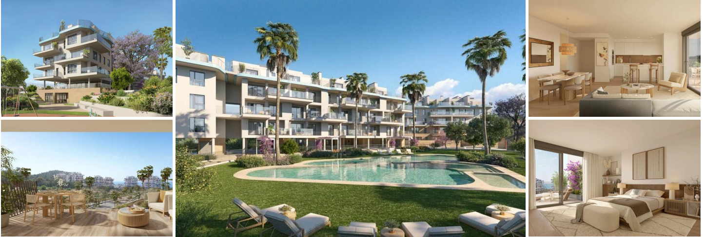
NEUBAU-KOMPLEX IN VILLAYOJOSA

Neue Wohnanlage mit 42 Wohnungen und Penthäusern in Villajoyosa, nur wenige Schritte vom Strand entfernt.