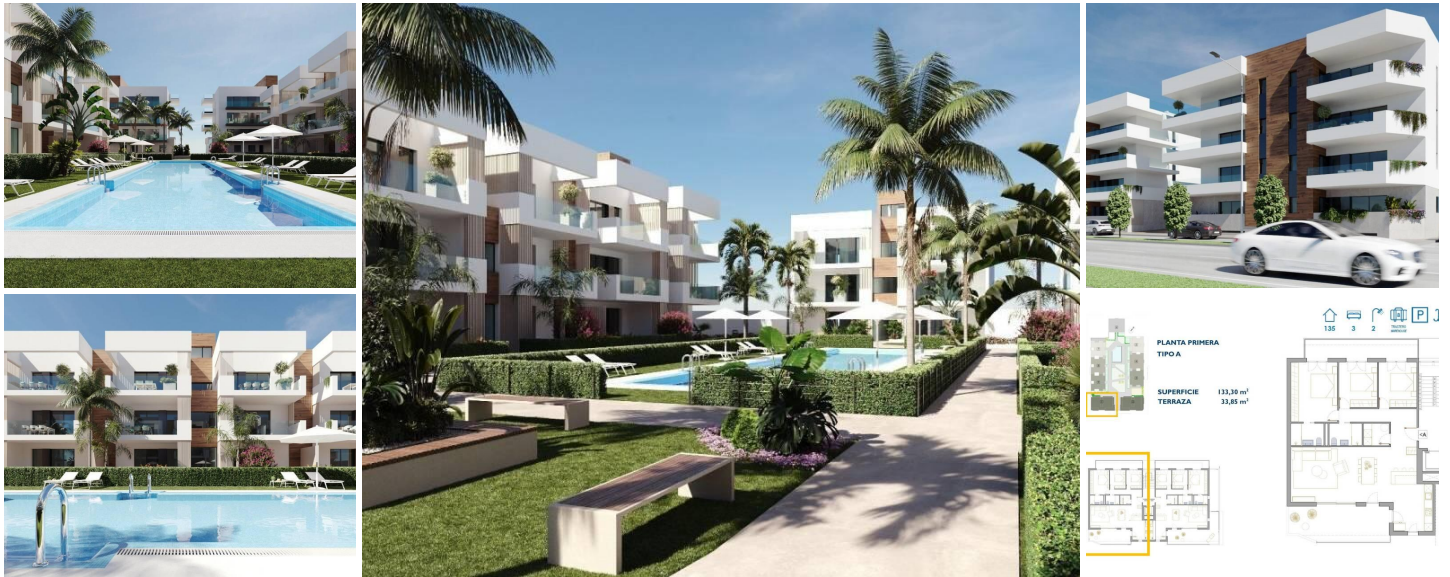
NEUBAU WOHNANLAGE IN SAN PEDRO DEL PINATAR

Neue Wohnanlage mit modernen Apartments und Penthäusern in San Pedro Del Pinatar.