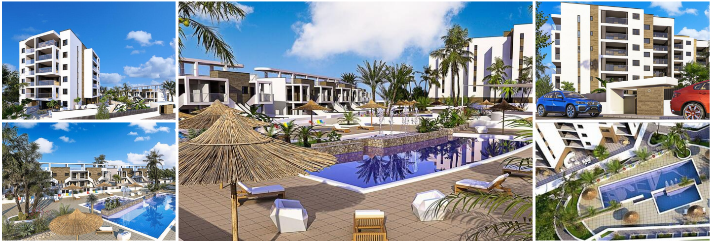
Neubau von Wohnungen und Bungalows in Mil Palmeras