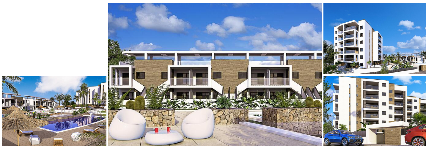
Neubau von Wohnungen und Bungalows in Mil Palmeras