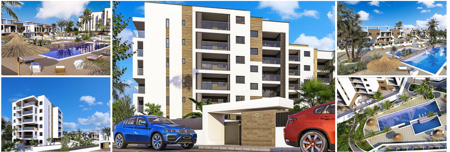
Neubau von Wohnungen und Bungalows in Mil Palmeras