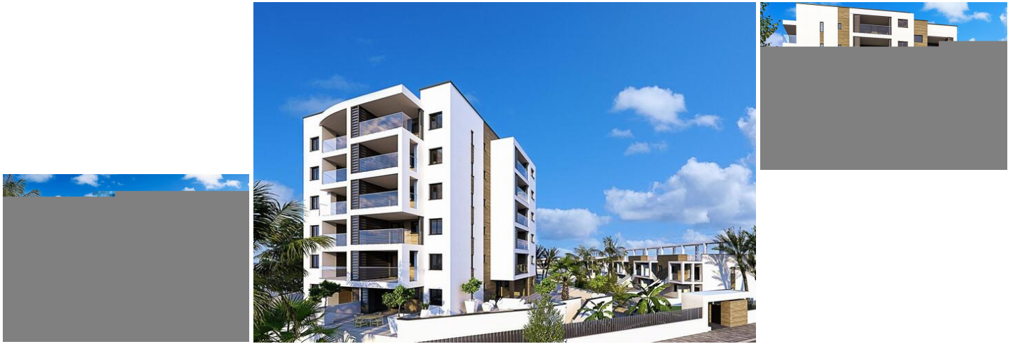
Neubau von Wohnungen und Bungalows in Mil Palmeras