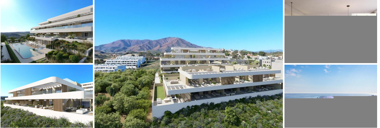
2-Schlafzimmer-Wohnung mit Meerblick

Dieses exklusive Boutique-Wohnensemble umfasst nur 25 sorgfältig gestaltete Wohnungen mit einem, zwei oder drei Schlafzimmern, verteilt auf zwei moderne, terrassenförmig angelegte Gebäude. Jede Wohnung ist zum Meer ausgerichtet, wodurch die Innenräume den ganzen Tag über mit natürlichem Licht durchflutet werden und einen atemberaubenden Blick auf die Mittelmeerküste bieten.